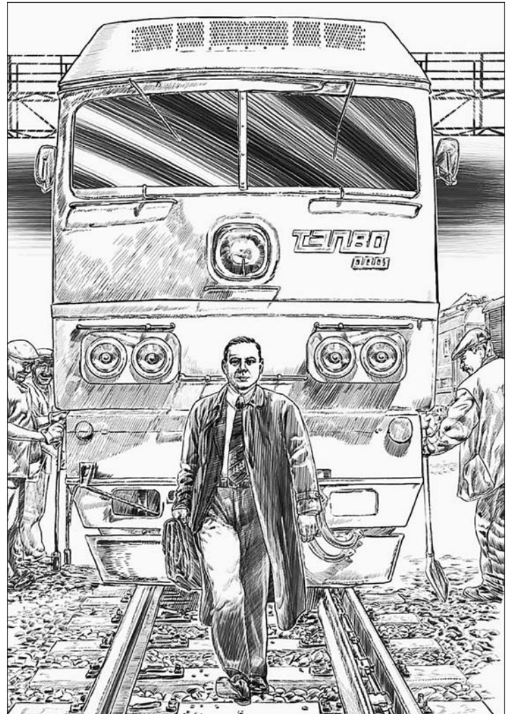
Рисунок из книги Владимира Гугнина «Российские изобретатели XXI века»

14 июля 2006 года прокатил своего создателя электровоз ЭП2К, работающий от сети постоянного тока, с экипажной частью, очень хорошо взаимодействующей с путем. В.В. Путину этот электровоз был представлен как «первая машина такого класса в истории российского транспортного машиностроения. До сих пор весь пассажирский транспорт работал на старых чешских локомотивах». И сам главный конструктор гордится им: «Создавая его, мы пытались применить всё, что было нового на тот момент. Считаю электровоз ЭП2К прежде всего своим личным делом». Специально для студентов пятого курса, которые сейчас изучают «Про-