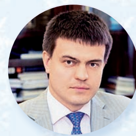
Михаил КОТЮКОВ, министр науки и высшего образования РФ

Дорогие друзья! От имени Министерства науки и высшего образования Российской Федерации и от себя лично поздравляю вас с наступающим новым, 2019 годом!