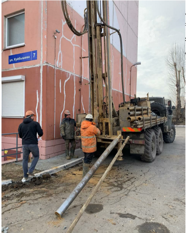
Рядом с провалом - десятиэтажка.

Эпичные кадры были сняты на Куйбышева, 7. Еще 8 апреля жители пожаловались на большую яму - просел асфальт. Но даже тогда и представить