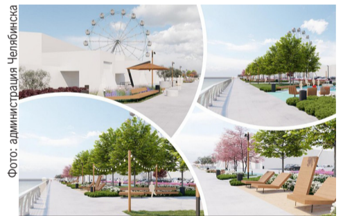
Погулять по обновленной набережной можно будет во второй половине лета

Как сообщили в администрации Центрального района, на время ремонта участок закроют. Но уже во второй половине лета горожане смогут отдохнуть на деревянных шезлонгах, крутящихся «барных» стульях и длинных скамейках, укрыться от солнца под чатырьями большими зонтами, сфотографироваться с арт-объектами.