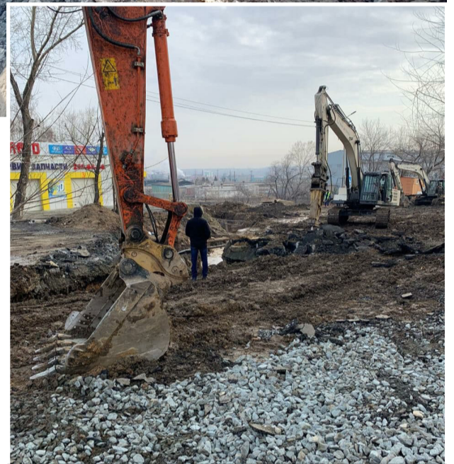
Прокуратура выяснит, из-за чего разрушился железобетонный коллектор.